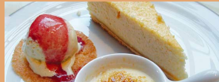
Desserts au lait de brebis.

Roquefort, Pérail, Feta, Tomme, Ewe's butter, Ricotta Ricotta is obtained by slow simmering of the whey collected when the curd is drained. This product, which looks rather like savannah, may be eaten savoury or sweet. It is mainly used for making the flaunes.